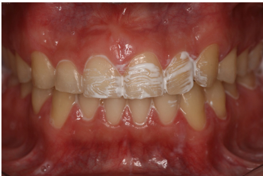
Figura 8 - Aplicação tópica do dentifrício dessensibilizante

mino deste tempo, relatou diminuição da sensibilidade, para nível 6 na escala. Por este motivo, o uso da pasta foi estendido por mais uma semana após a primeira sessão do clareamento, onde o paciente relatou sensibilidade nível 5.