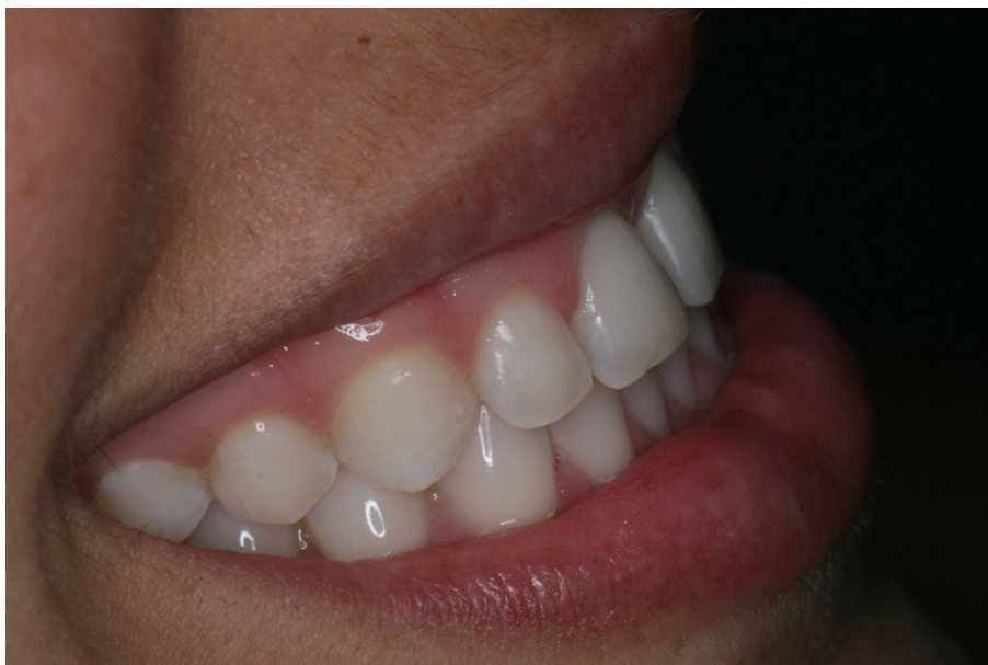
Figura 6 - Resultado final da cor do dente do paciente 1, mostrando sorriso de perfil