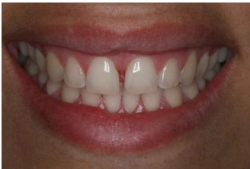
Figuras 1 - Foto inicial do sorriso do paciente 1, mostrando sorriso frontal

Paciente de 22 anos, apresentou cor dos dentes variando entre A2 e A3 na escala VITA (Figuras 1 e 2), a sensibilidade inicial na escala (VAS) foi nível 4, na cervical de incisivos e caninos superior e inferior.