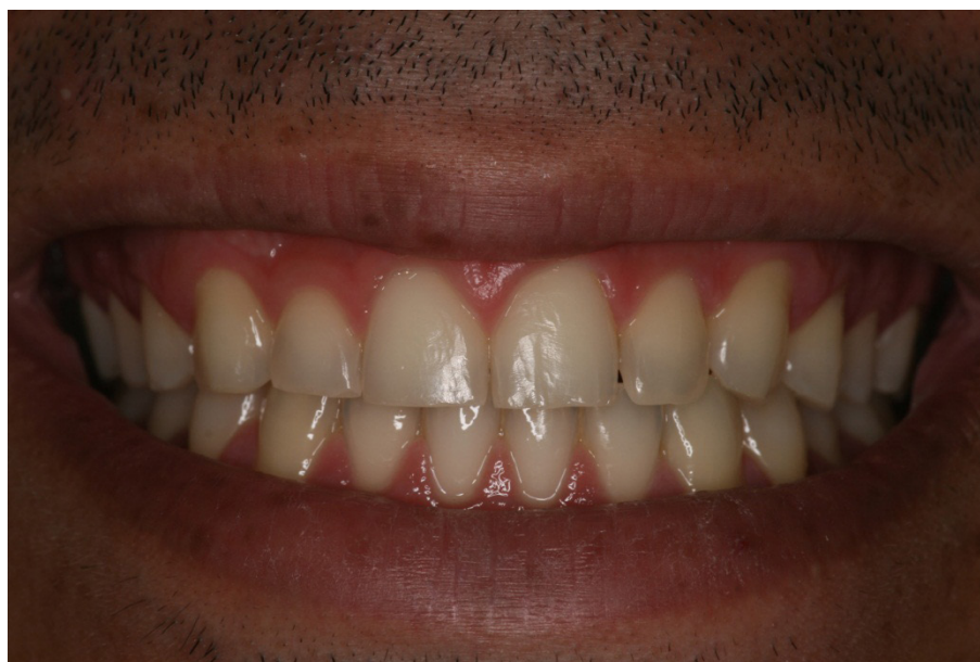
Figura 9 - Resultado final da cor do paciente do caso 3

Neste dente, foi observada uma área de ligeiro desgaste cervical na face vestibular. O paciente relatou sensibilidade nível 4, logo em seguida ao final das sessões, diminuindo no período de duas horas e cessando ao final do dia. A cor final registrada na escala VITA variou entre B2 (incisivos) e A2 (caninos e pré-molares) (Figura 9).