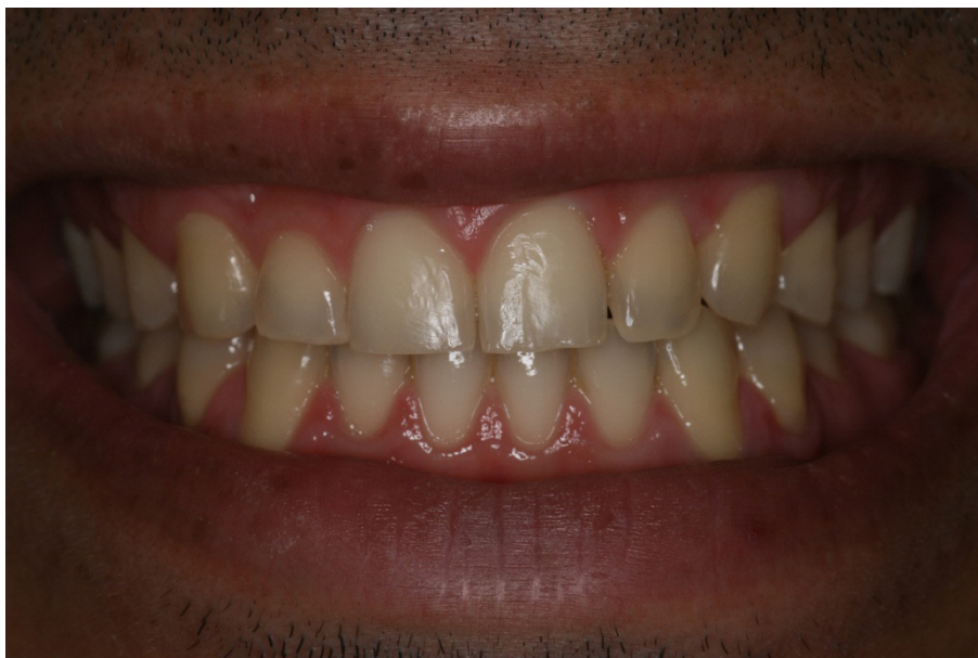
Figura 7 - Fotografia inicial do paciente 3

Este paciente fez uso do dentifrício dessensibilizante Colgate Sensitive Pro alívio (Colgate-Palmolive, New York, NY, USA), durante uma semana antes do clareamento, massageando os dentes sensíveis por 30 segundos cada (Figura 8). Ao tér-