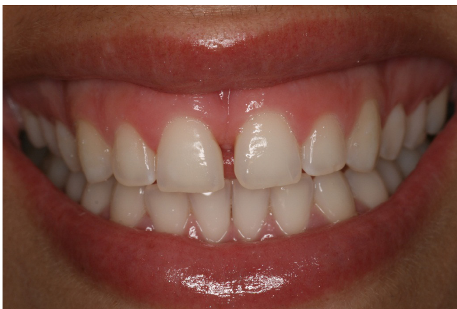
Figura 5 - Resultado final da cor do dente do paciente 1, mostrando sorriso frontal

dias de uma sessão para outra. O paciente não relatou sensibilidade durante o clareamento, porém relatou sensibilidade nível máximo da escala no período de duas horas após o clareamento, em todas as sessões, cessando ao final do dia. Ao final do tratamento a paciente apresentou coloração B1 na escala VITA (Figuras 5 e 6).