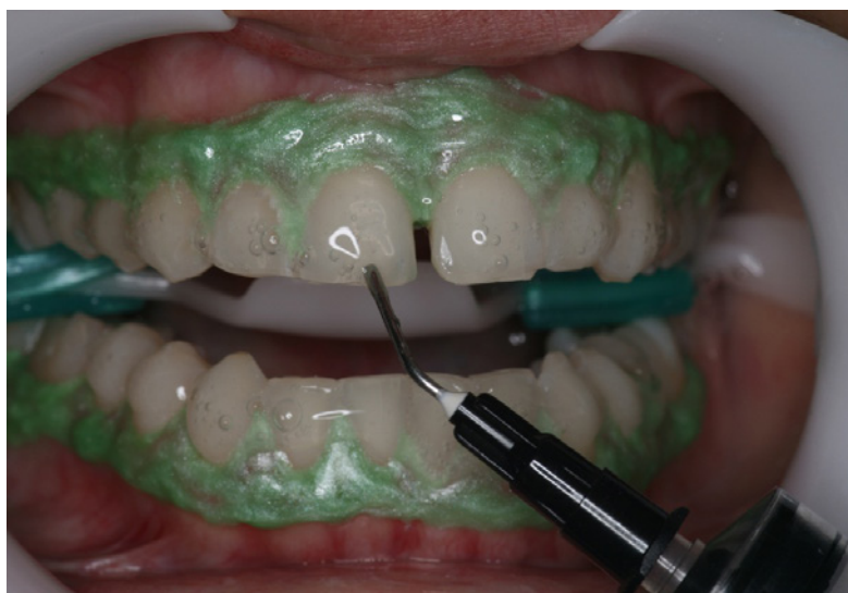
Figura 3 - Etapas do clareamento dental do caso clínico 1/ Aplicação do gel clareador

de coloração transparente. Após aplicação do gel na face vestibular dos dentes (Figura 3), foi feita a ativação com luz a base de LED (DMC Equipamentos, São Carolos, São Paulo) por 15 minutos, com o laser desligado (Figura 4). Decorrido esse tempo, o gel foi removido com sucção abundante e bolinha de algodão. Foram realizadas mais duas sessões de 15 minutos, totalizando 45 minutos do gel em contato com o dente. A movimentação do gel foi feita com espátula para melhorar a liberação de oxigênio e o contato do gel com o dente. Ao final da última sessão, o gel foi removido com sucção e lavagem abundante, a barreira removida e o afastador retirado.