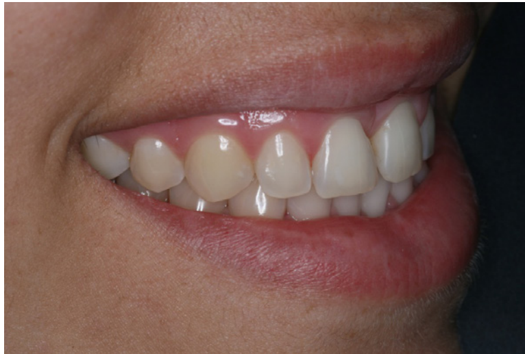
Figura 2 - Foto inicial do sorriso do paciente 1, mostrando sorriso de perfil

Para a realização do clareamento, foi posicionado o afastador de lábios e língua (ArcFlex, FGM, Joinville, SC, Brasil), os tecidos moles foram secos com a seringa tríplice e a barreira gengival fotopolimerizável (Lase Protect, DMC Equipamentos) foi colocada para proteção dos tecidos gengivais e fotopolimerizada por 20 segundos, a cada grupo de 3 dentes.